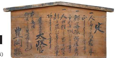
明治新政府の命で 豊岡県が立てた高札 豊岡県高札 (兵庫県所蔵・パネル展示)