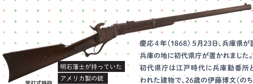
明石藩士が持っていた アメリカ製の銃