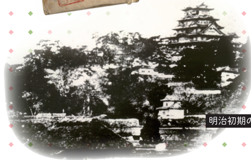
明治初期の姫路城