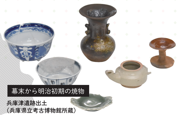
幕末から明治初期の焼物 兵庫津遺跡出土 (兵庫県立考古博物館所蔵)