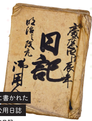
慶応4年に書かれた 柏原藩の公用日誌