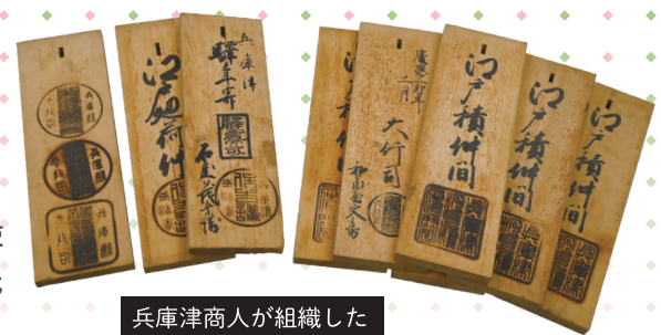
兵庫津商人が組織した 江戸積み仲間(同業者組合)の木札 住吉講江戸積鑑札ほか(個人蔵)

慶応4年(1868)5月23日、兵庫県が誕生し、兵庫の地に初代県庁が置かれました。初代県庁は江戸時代に兵庫勤番所として使われた建物で、26歳の伊藤博文(のちの初代内閣総理大臣)が初代県知事になりました。兵庫県が生まれた1868年は、兵庫が開港して外国人が住む居留地がつくられ、戊辰戦争が起こるなど、江戸から明治へと変わる時代の転換点でした。この展覧会では、初代県知事伊藤博文の手紙、古文書、古写真、遺跡から発掘された考古資料といった「1868年のドキュメント」を展示し、江戸時代らしさが残りつつも新しい時代へと変わっていった「ひょうごはじまりの時」をたどります。