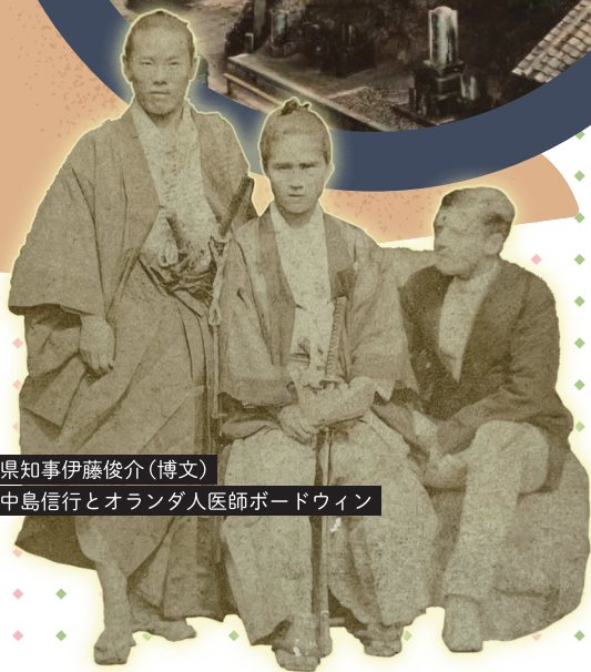
兵庫県知事伊藤俊介(博文) 判事中山島信行とオランダ人医師ボードウィン